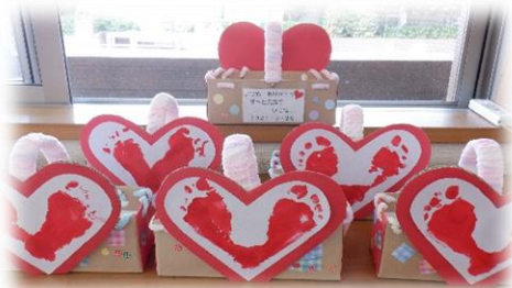
※写真は昨年度の作品です♪

おじいちゃんおばあちゃんへ、『ありがとう』の気持ちを込めて、プレゼントを作ってみませんか？ ベビー・キッズ向けに分かれていますので、ご確認ください♪